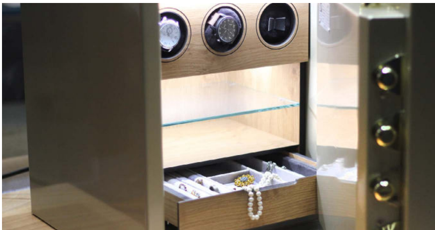
Präzisere Vorgaben, zum Beispiel was die Aufbewahrung von Wertsachen und Bargeld betrifft.

und Bargeld präziser fest. Neu ist explizit auf die anfallenden Gebühren zu achten. Weiter werden die zulässigen Anlagemöglichkeiten entsprechend den unterschiedlichen Bedürfnissen erweitert. Für die mit der Vermögensverwaltung beauftragten Personen und die Betroffenen selber werden die Regelungen besser nachvollziehbar und die Handhabung wird einfacher. ■